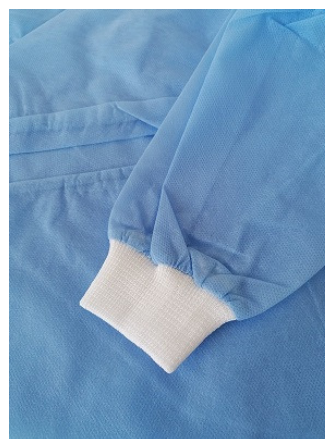
Dettaglio polsino in maglia