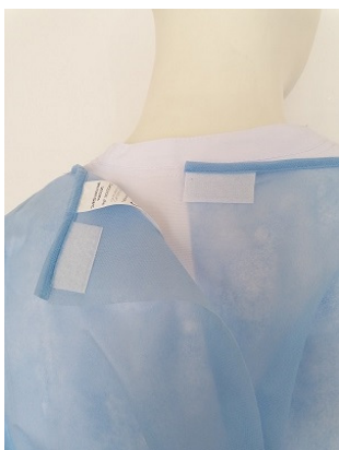
Dettaglio chiusura con velcro